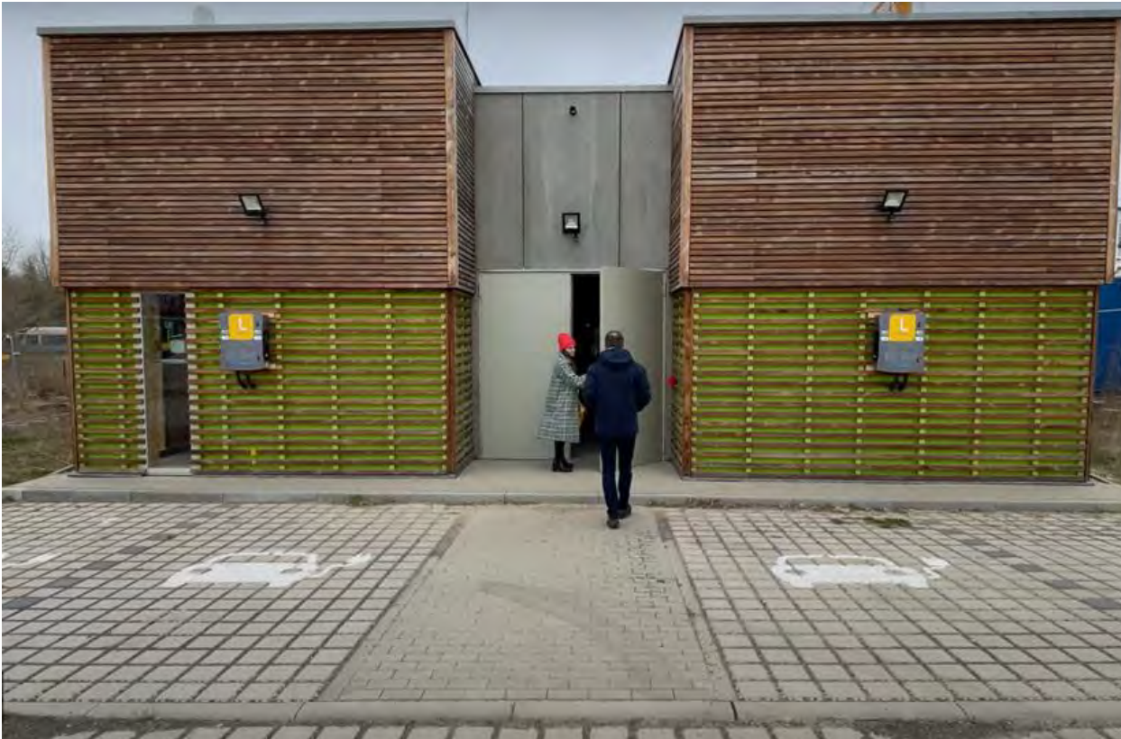
Bild: Heizhaus in Schkeuditz